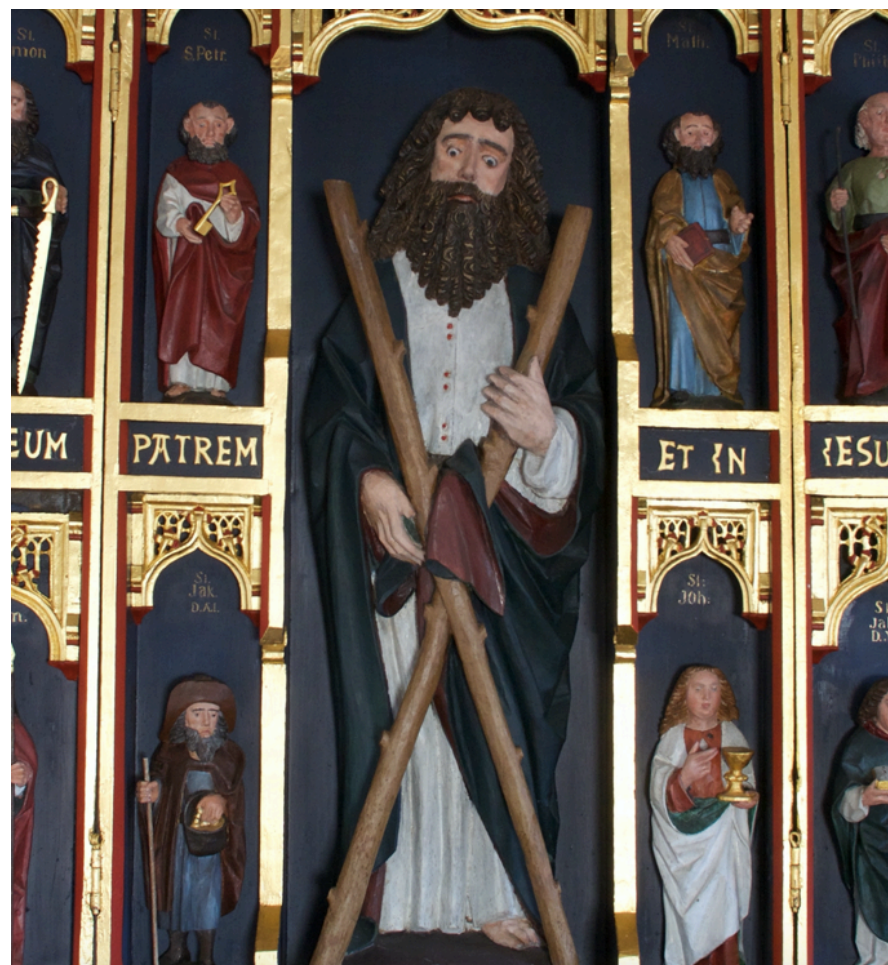
Pilgrimsdisciplen Andreas er i centrum i Kornerup kirke (jvnf. Klosterrutens logo)